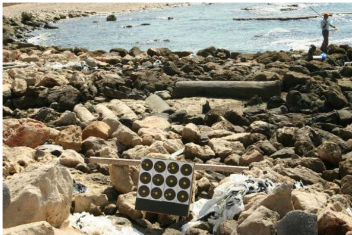
בין סלעי החוף