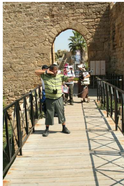
מראה מעל הגשר

ביום שבת בצהריים אחרי שרוכזו כל התוצאות של ניקוד הפגיעות שהיו במשך יומיים בשטח, התקיים גמר תחרות של ארבעת המובילים בכל סוג של קשת , וכן נוער בנפרד, בשלב זה המפסיד יוצא ולמעשה שלושת המנצחים בפיינלים זוכים בגביעים. בגמר יורים ל- 4 טווחים שונים ומטרות בגודל שונה, אך כמובן שהקושי הגדול נעוץ בעובדה שיריים אחד על אחד והמתח עצום.