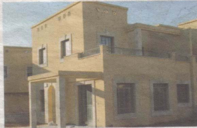
הבית הירוק בקיסריה

מעיין ודניאל גרשוני החליטו לבנות בקיסריה בית "ירוק" שכולל: מערכת מיחזור מים, מערכת אנרגיה סולרית וגינה אורגנית