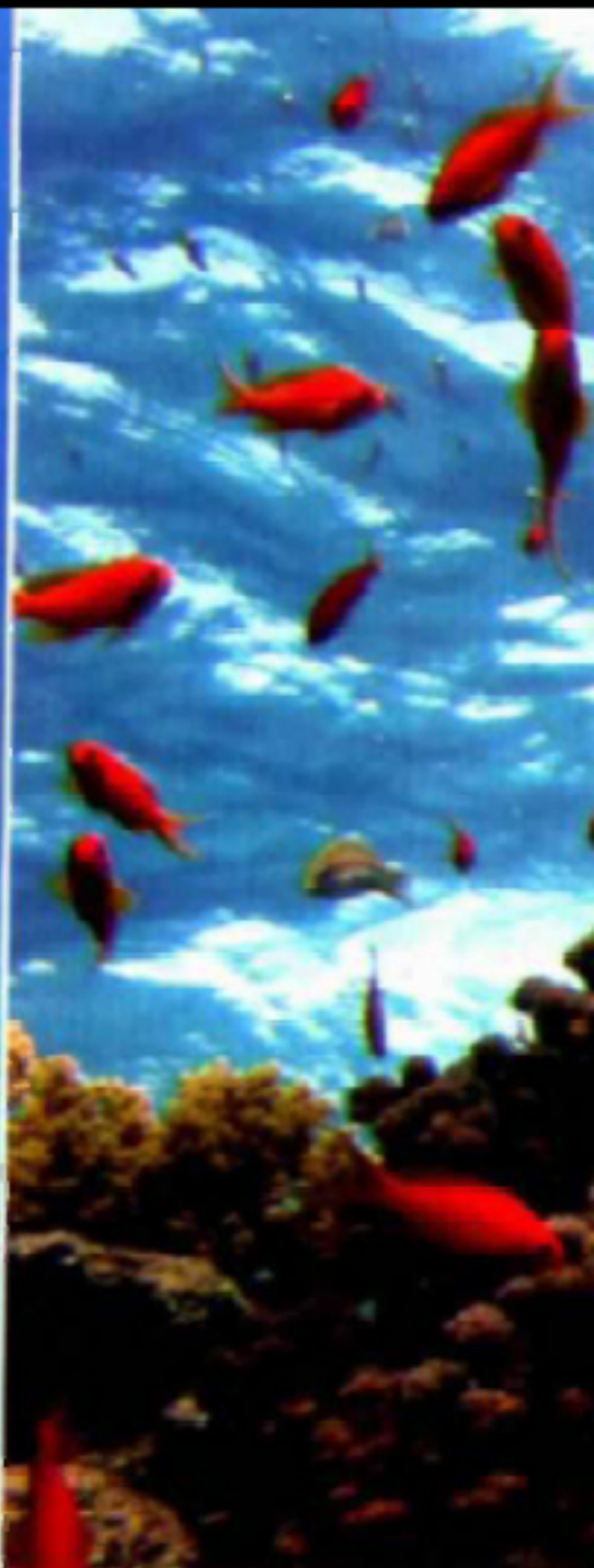
זהרון, דג יפהפה וארסי החי בים סוף

החוף הצפוני ביותר של ישראל מציע חוויה מסוג שונה לגמרי: צלילה בתוך נקרות חצובות באבן גיר רכה, כשקרני השמש החודרות מבעד המים יוצרות משחקים מעניינים של אור וצל.