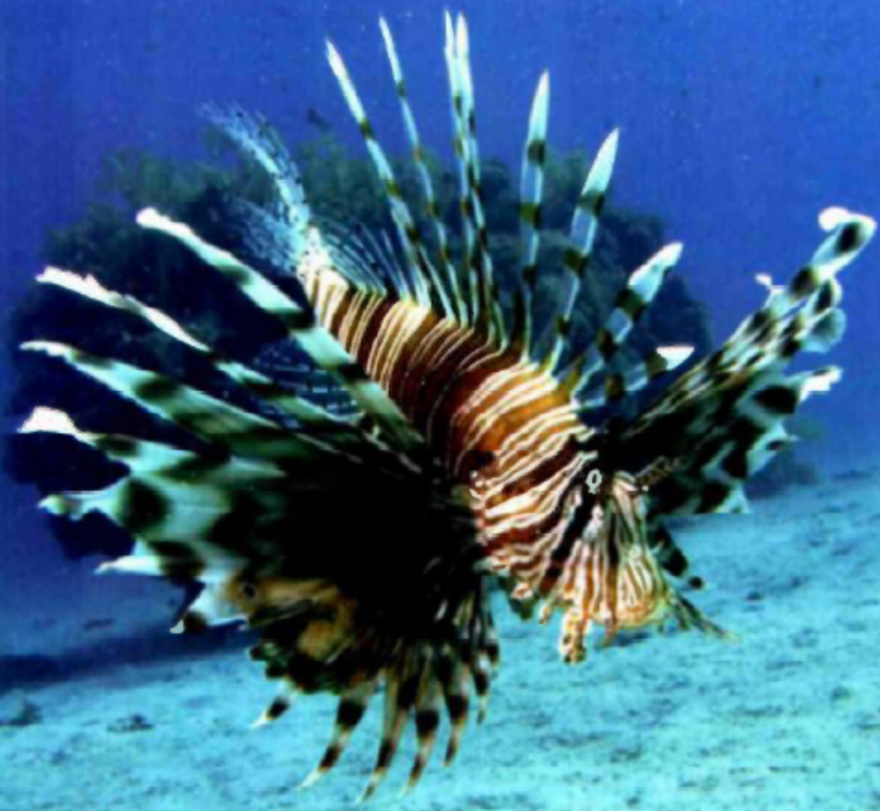
לוי: סטיבן סטיבן