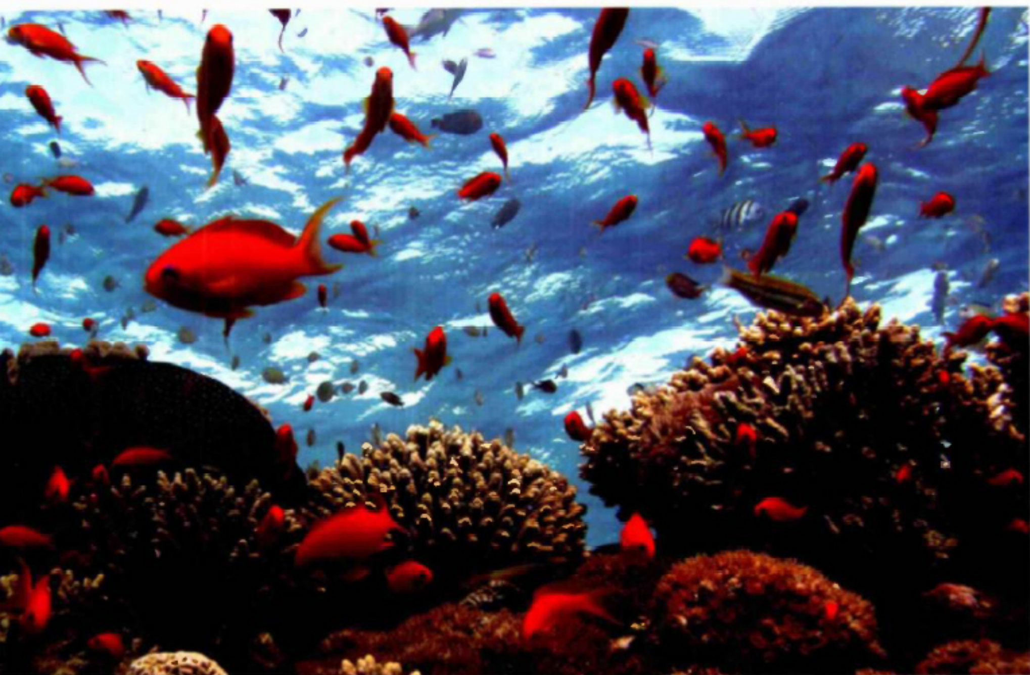
דני ים סוף בשונית אלמוגים, מפרץ אילת